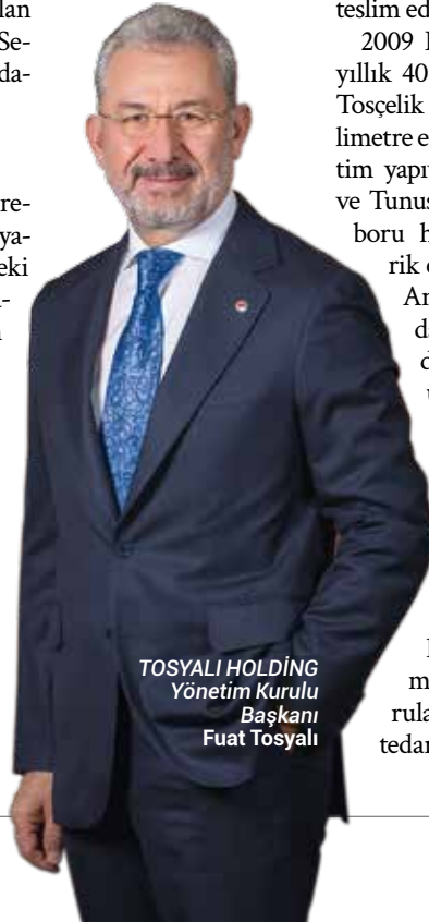
TOSYALI HOLDİNG Yönetim Kurulu Başkanı Fuat Tosyalı

2009 Nisan ayında faaliyete geçen ve yıllık 400 bin ton kapasiteye sahip olan Tosçelik Spiral Boru, 6-120 inç ve 28 milimetre et kalınlığına kadar ölçülerde üretim yapıyor. Cezayir için 500 kilometre ve Tunus için 400 kilometrelik doğalgaz boru hattı projelerini başarıyla tedarik eden Tosçelik Spiral Boru, Trans Anadolu Doğalgaz Boru Hattı'nın da 470 kilometrelik bölümünü tedarik ederek projenin ana boru üreticisi olma gururunu yaşadı. Nisan 2018'de Bulgaristan, Romanya, Macaristan ve Avusturya'yı birbirine bağlayacak olan BRUA Doğalgaz Boru Hattı Projesi için Romen Transgaz ile 127 milyon avruluk sözleşme imzalayan Tosçelik Spiral Boru, 32 inç çapında ve 478 kilometre uzunluğunda doğalgaz boruları ve bağlantı ekipmanlarının tedarikini sürdürüyor.