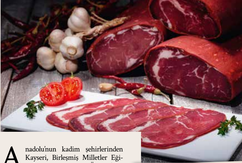
Kayseri Büyükşehir Belediye Başkanı Memduh Büyükkılıç 6 bin yıllık tarihe sahip Kayseri'nin gastronomi şehri olarak da ön plana çıktığını belirtti.